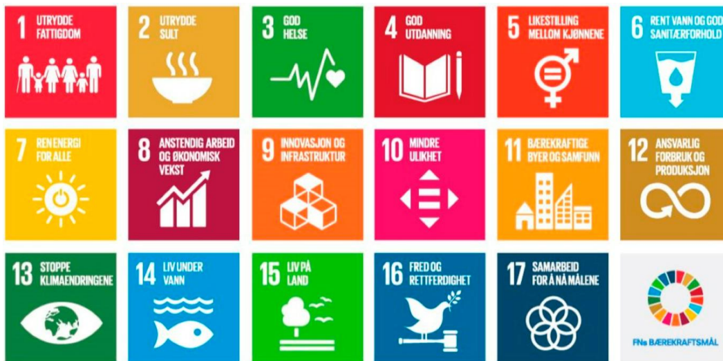
FN sine 17 bærekraftsmål

Følgjande regionale planar er særskilt relevante for kommuneplanarbeidet: