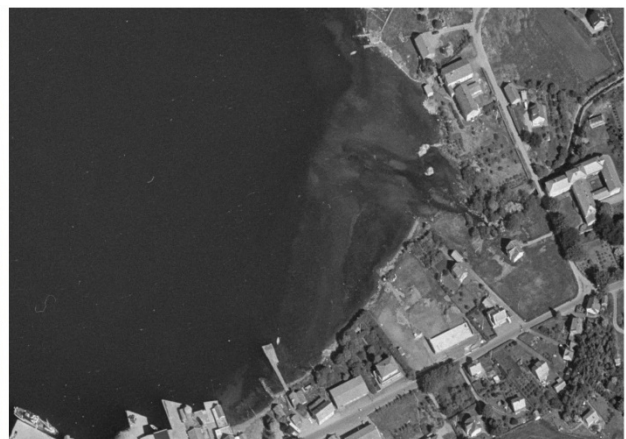
Til venstre, flytfoto av område i 2021. Til høgre, flyfoto av området i 1969.