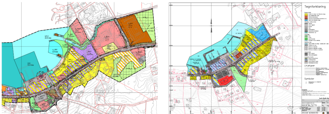
Til venstre, utsnitt frå forslag til reguleringsplan for Fitjar sentrum. Til høgre, plankart til reguleringsplan for Fitjar sentrum (Nasjonal arealplanid: 4615_200703; ikraftsetjing 19.09.2007).

For arealføremåla «Bustadblokker» (BBB1) og «Helse/omsorgsinstitusjon» (HOI1) blir det føreslått at det kan fyllast i sjø til føremålsgrensa. For BH1 kan det fyllast i sjø som vist i forslaget til plankart. Utfylling i sjø for arealføremåla i dette området må, slik vi ser det, takast ut av føresegnene. Arealføremåla må trekkjast attende frå strandlinja slik den er i dag. Byggjegrænsene mot sjø må også trekkjast attende, og det må gjerast nye vurderingar av strandsoneverdiene i området. Vi viser til at byggjegrænse mot sjø og føremålsgrenser avvik frå det som var fastsett i reguleringsplanen for Fitjar sentrum (2007). Ved fastsetjing av byggjegrænse mot sjø må det gå klart fram korleis strandsoneverdiene er vurdert, jf. pbl. § 1-8 og rundskriv T-2/16 – rev. februar 2021, avsnitt 3.11.