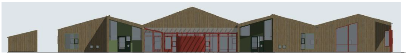
Fasade mot sør-vest, Arkitektene Vis-a-Vis

Etter arkitektkonkurransen vart Arkitektene Vis-a-Vis kåra som vinnarar og detaljprosjektering pågår parallelt med planarbeidet.