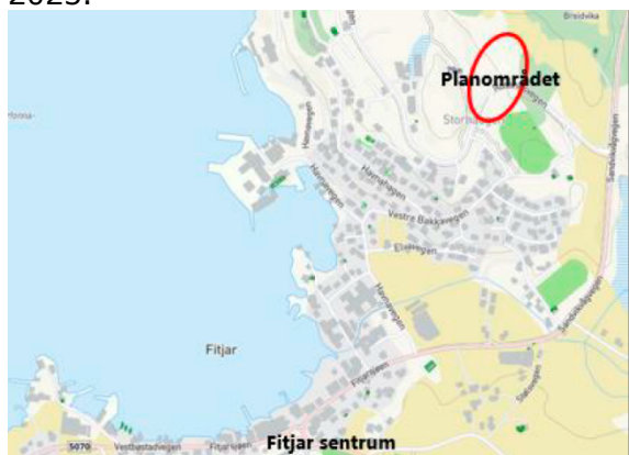
Lokalisering av planen

Den nye barnehagen skal byggjast i område som i dag ligg som landbruksføremål LL i gjeldande reguleringsplan for Hamn (Rossneset) PlanID 201102, og som boligbebyggelse nåværende i gjeldande kommuneplan. Det må difor ei reguleringsendring til. I vedtaket i kommunestyret pkt 3 ligg at arealføremålet må regulerast inn i eksisterande reguleringsplan for Rossneset. Administrasjonen har i samråd med sakkunnig konsulent for planarbeidet ABO Plan- og arkitektur Stord AS kome fram til at ein eigen plan for barnehagen vil gå raskare enn om ein opnar opp for endring heile planen for Rossneset. Barnehageprosjektet har ein relativ stram framdriftsplan med både regulering og arkitektkonkurranse, og ein har difor valt å kjøra denne planprosessen som ein eigen ny plan. Barnehagen skal stå ferdig til barnehageåret 2023/24, dvs innflyttingsklar august 2023.