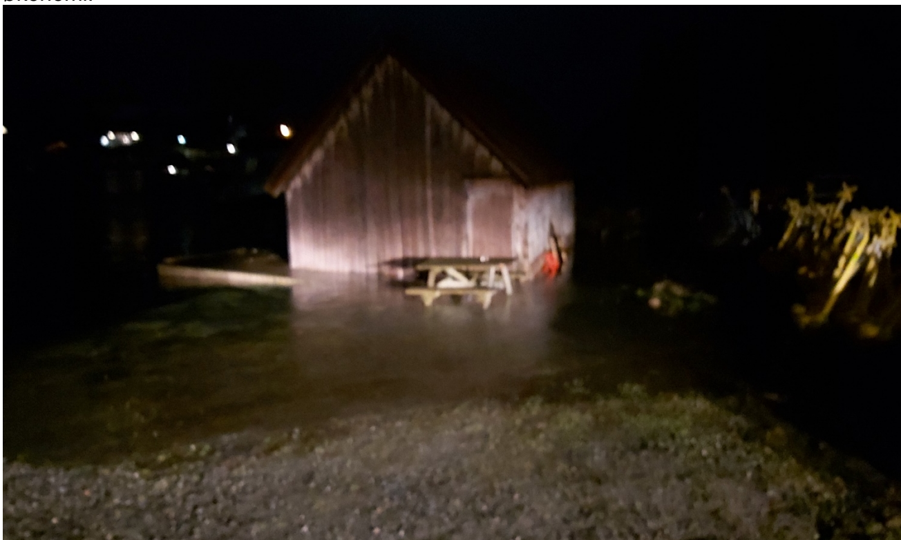
Stormfloer ser ut til å komme stadig tettere og skaper utfordringer for drifta av områdene.

På sommeren vil tradisjonelle driftsoppgaver som grasklipp, bossplukk, vask av toaletter, utlegging av badebøyer bli prioritert. Vedlikeholdsarbeid på bygninger, brygger, info- og livbøyetavler, veier og parkeringsplasser vil bli utført hele året etter behov, kapasitet og økonomi.