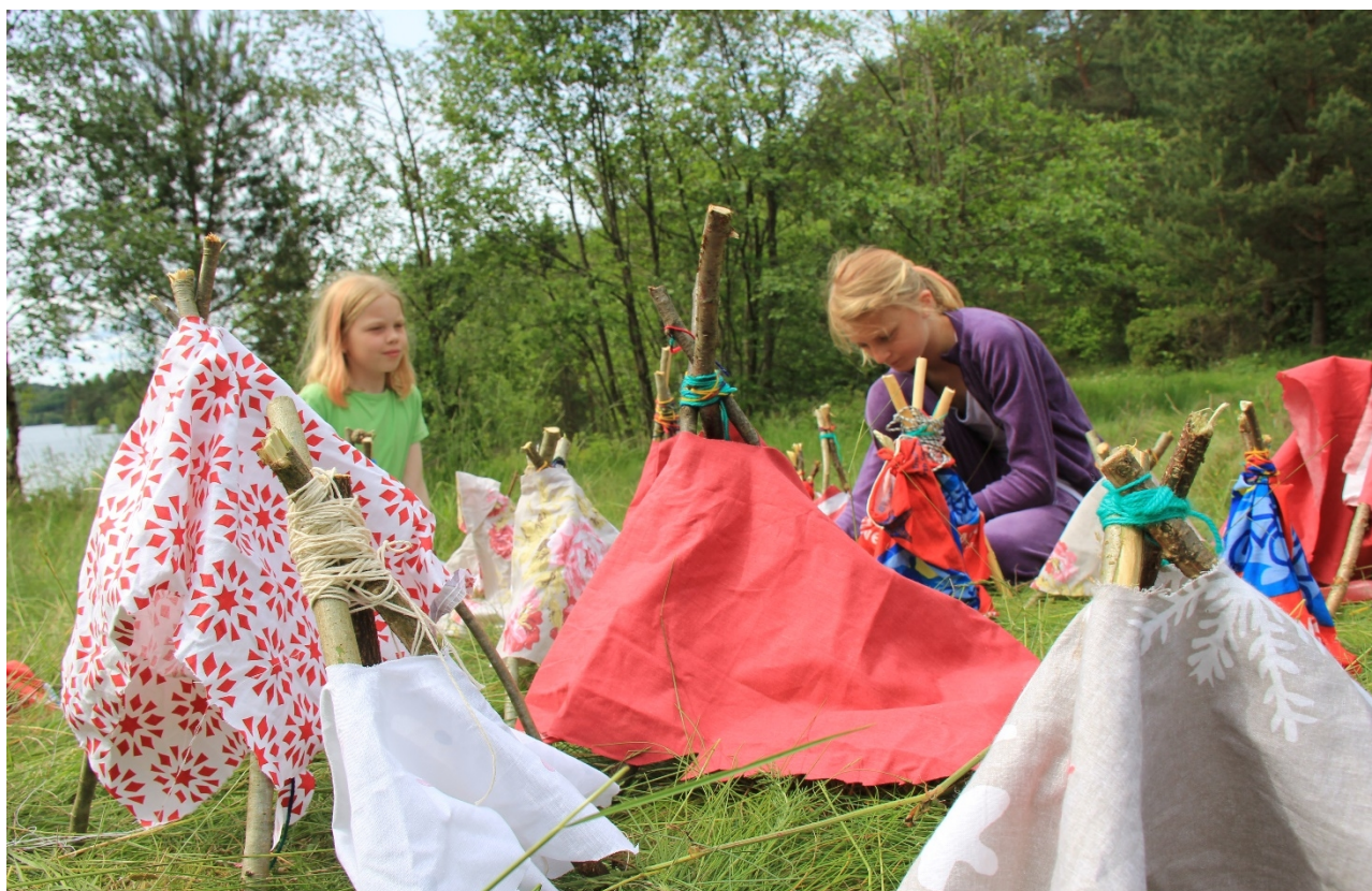
Samisk dag på Stord – Sami duodji - elevene lager en samelandsby i miniatyr.

Naturveiledning for elever og friluftskurs for lærere. Covid19 førte til en betydelig reduksjon i utførelsen av aktivitetsprosjekter i 2020. Fra nedstengingen 12 mars var det ingen utedager med elever eller lærere før mot slutten av mai. Både Beintøft på Lindøy (250 elever) og overgangsleirene for nye ungdomsskoleelever (1200 elever) ble avlyst. Da det ble lettet på restriksjonene fikk vi på nytt noen henvendelser om utedager og vi gjennomførte 6 utedager med skoleklasser med 300 elever i løpet av 3 uker i juni og 4 utedager på høsten. Karmøyskolen gjennomførte overgangsleiren på Stemnestaden i september over 7 dager med ca. 600 elever.