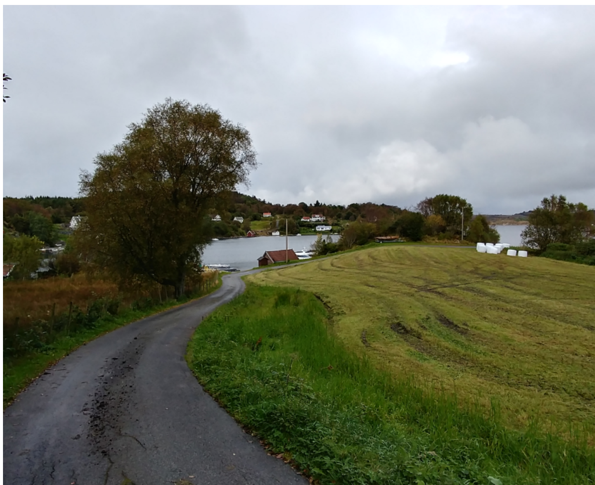
Utsikt over deler av Lindøy gård nordøstover mot Røyksundet. Eksisterende naust i delområde 1 ligger midt i bildet.