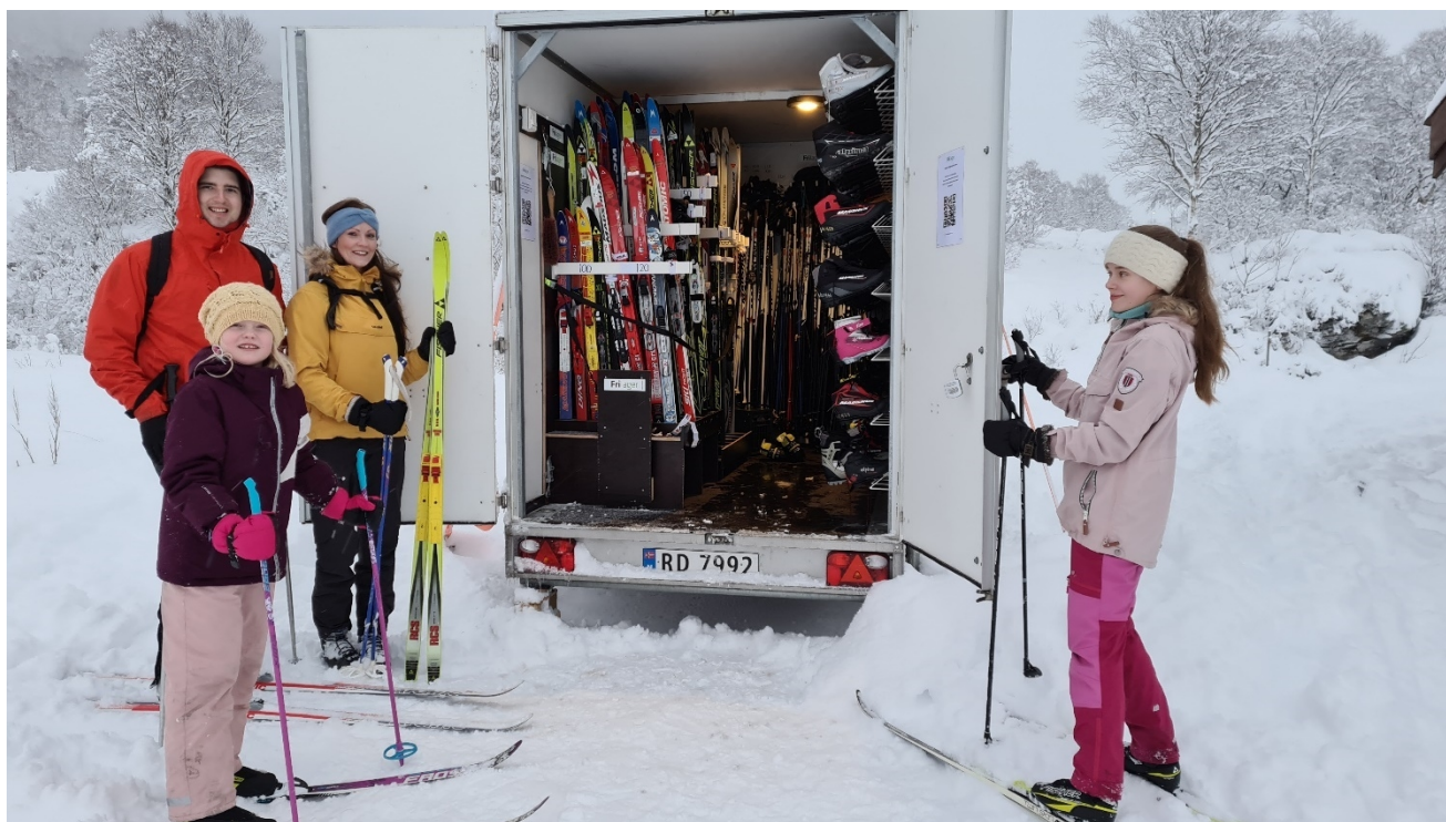
Frilager startet opp 10. januar 2021 med utleie/utlån fra skitilhenger i Olalia og fra Aksdal.

Organisasjonen «Frilager Haugalandet» ble etablert høsten 2019 og har som målsetning å kunne tilby rimelig og til dels gratis friluftsutstyr til befolkningen på Haugalandet. Organisasjonen eies av Friluftsrådet Vest, Haugesund Turistforening og Haugesund Røde Kors. Oppstarten ble satt på vent i coronaåret 2020, men Frilager startet opp med skiutleie og skitlån fra en skitilhenger i Olalia januar 2021, og satser på å bygge ut tilbudet med kanoer og annet friluftsutstyr utover våren og sommeren. Målet for 2021 er å skaffe politisk aksept for tiltaket og skaffe midler til utstyrlager, lagerarealer og ansette noen til å drive virksomheten. Det er målsetting å utvide frilageret til flere kommuner hvis ordningen blir vellykket. Det meste av friluftsutstyret både vi og de andre stifterorganisasjonene i dag låner ut til skoleklasser og andre er tenkt overført til frilageret. Nettside: www.frilager.no