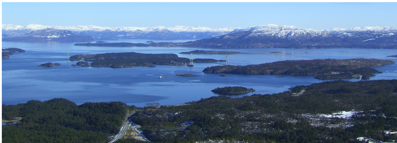
Utsikt fra Siggjo mot Føyno og Tittelsnes i Sveio.

I 2020 har vi arbeidet med å sikre nye områder til friluftsliv, og det er blitt arbeidet med å sikre avtaler for ny p-plass og tilkomst til Leirvågen i Sveio. Det er undertegnet en stiaftale til Jonestølen fra Hustveit i Sauda, og vi har bistått Stord kommune i arbeidet med å sikre areal for utvidelse av p-plassen for utfartsområde til Heio som er et viktig utfartsområde sommer og vinterstid på Stord. Vi har bistått Bømlo kommune med å få i stand avtaler med grunneiere for oppgradering av turstitråsen til toppen av Siggjo som er et viktig turmål for hele regionen. Erfaringen viser at enkelte saker krever innsats over lang tid før vi får på plass en avtale eller kjøp.