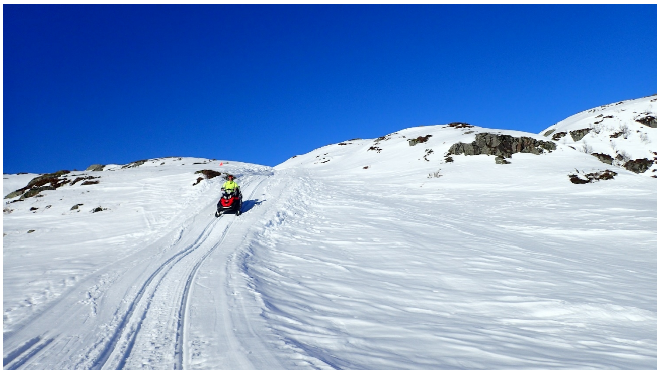
Løypekjøring i Fjellhaugen, Kvinnherad

Friluftsrådet har hatt flere innslag på lokale radiokanaler/aviser/ NRK i forbindelse med tellinger Djupadalen, marin forsøpling, Blått flagg Åkrasanden, TellTur, badetemperaturer, ski- og løypemeldinger, Basecamp Uskedalen og Lindøy, opparbeidingstiltak m.m.