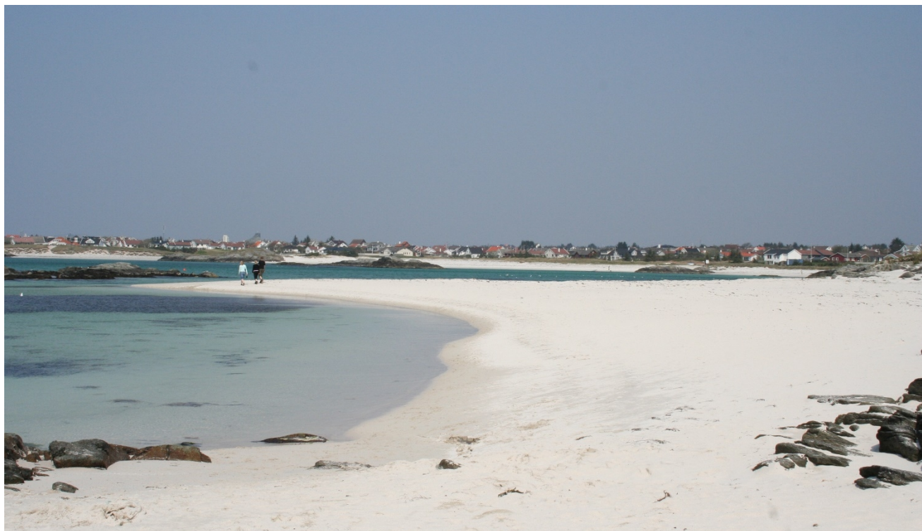
Åkrasanden på vestsida Karmøy

Sikring av friluftsområder vil fortsatt være en sentral oppgave, i samarbeid med medlemskommuner, fylkeskommunene og staten ved Miljødirektoratet.