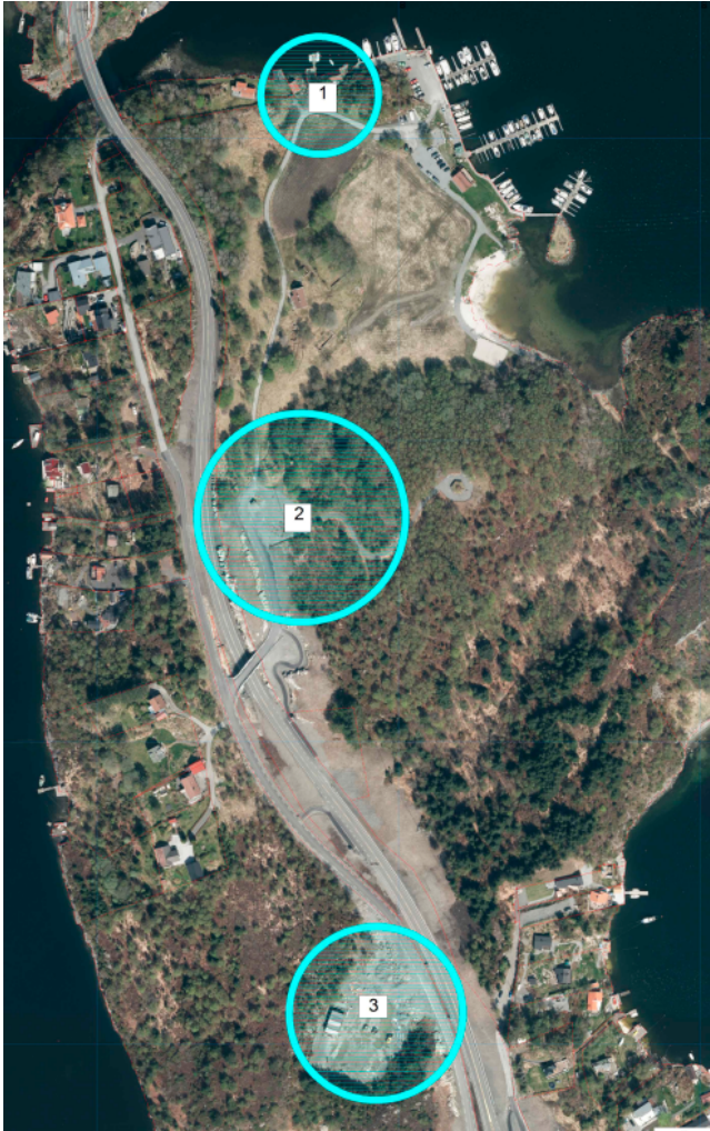
Oversiktskart over delområdene 1-3. Administrasjons- og aktivitetsbygg skal ligge i delområde 2