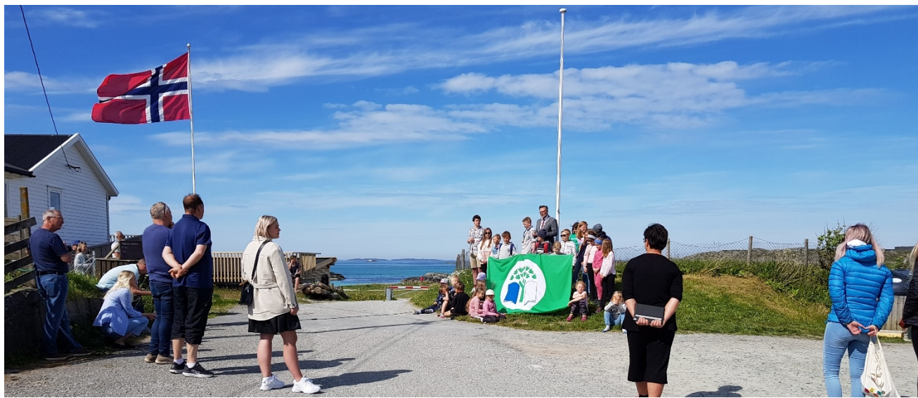
Åpning av «Blått flagg» stranden på Åkrasanden juni 2020

Friluftsrådet Vest vil takke medlemskommunene, miljøvernavdelingen hos Fylkesmannen i Rogaland og i Hordaland, Rogaland fylkeskommune, Hordaland fylkeskommune, Friluftsrådernes Landsforbund, andre friluftsråd, Miljødirektoratet, Klima og miljødepartementet, Statens naturoppsyn, Haugesund Sparebank, Ragn-Sells A/S, Hold Norge Rent, Sparebankstiftelsen SR bank, Gjensidigestiftelsen, og flere frivillige organisasjoner og mange privatpersoner for hyggelig kontakt og godt samarbeid i 2020.