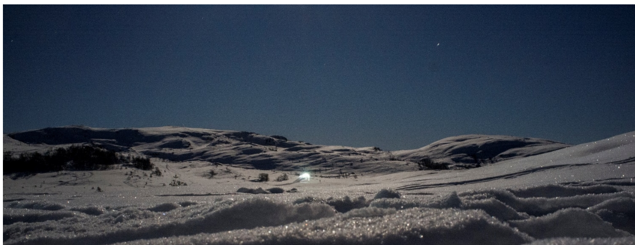
Olalia kan nytes i måneskinn eller med både måneskinn og hodelykt.