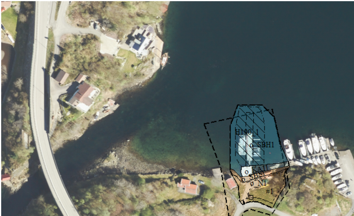
Illustrasjonen viser planens avgrensning i forhold til farleden gjennom Røyksundet.

I delområde 2 åpner planen opp for et administrasjonsbygg med tilhørende undervisningsrom/møterom mv. på maks 600 m 2 , derav 400 m 2 grunnflate (BRA). Bygget skal ha maks 2 etasjer. Parkeringsareal skal utvides noe. Eget område er satt av for renovasjonspunkt. Det er satt byggegrense for administrasjonsbygg mot parkering (og fylkesvei). Korteste avstand mellom mulig nytt bygg (formålsgrense TY/UND/BEV/K1) og fylkesvei er 35 m, men i praksis vil et nytt bygg ligge lenger vekk. For øvrig tillates oppføring av parkeringsplass, renovasjonsanlegg, energianlegg mv. innenfor formålsgrensene, selv om disse ligger mindre enn 50 m fra fylkesvei.