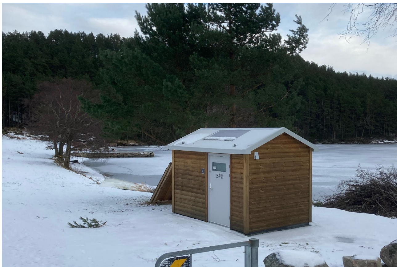
Nytt toalett i Breiavikjo ved Storavatnet, Fitjar

I flere av friluftslivsområdene har vi iverksatt tiltak med rydding av kratt og skog. Tilsyn og drift av enkelte områder ble utført av organisasjoner mot avtalt godtgjørelse. I Fitjar, Sauda, Bømlo, Vindafjord, Etne og Kvinnherad har vi hatt et godt samarbeid med foreninger og lokale tilsynsfolk som har ansvaret for tilsyn av områdene.