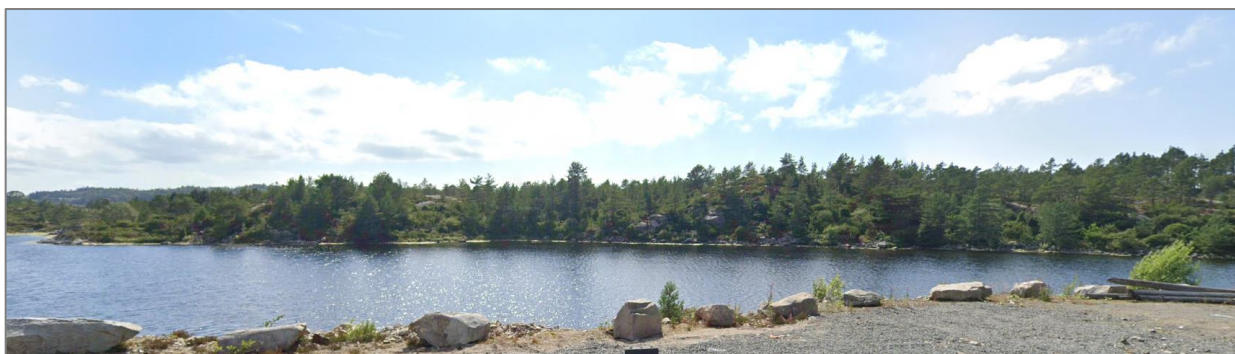
Figur 3 Bilete frå området

Området er per i dag lite utbygd, og framstår som eit naturområde. Innanfor området er det tre bygde fritidseigedomar, samt ein under utbygging. I tillegg er det starta arbeid med nydyrking av eit areal innanfor planområdet. Det er bygd veg ned til Skykkjeneset.