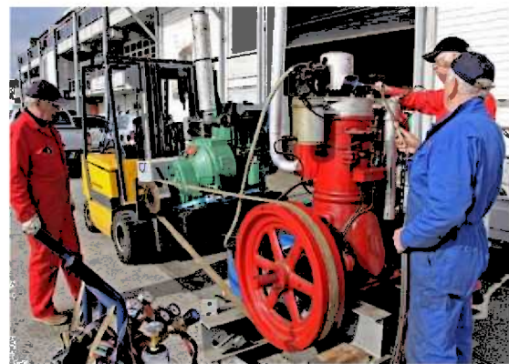
Stord Maritime museum