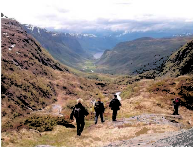
Stordalen frå Bjødnanut

Etnefjella strekker seg om lag 5 mil frå Ølen i vest til Seljestad i aust. Der går T-merka løyper gjennom heile området og har seks turisthytter i regi av Haugesund Turistforening. Frå Etnesida er der rundt ti oppgangspunkt til fjellet, spreitt jamt ut frå Etne i vest, via Stordalen og austover langs E-134 i Åkrafjorden.