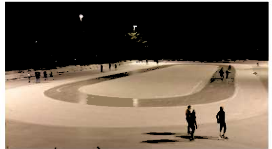
Skeisebanen på Stord

Banen vart offisielt opna i 2001 og er med sine 5000 m 2 den største kunstfrosne isflata på Vestlandet. Rundløpsbana er på 250 m og er den fyrste i sitt slag i Noreg. Banen har flomlys, høgtalar/musikkanlegg, varmistove med toalett, garderobar, dusj, kiosk og eit stort fellesrom. Normal opningstid for banen er oktober-mars. Det er planar om å byggja hall over banen. Søknad om ny teknisk godkjenning er sendt i mars 2016.