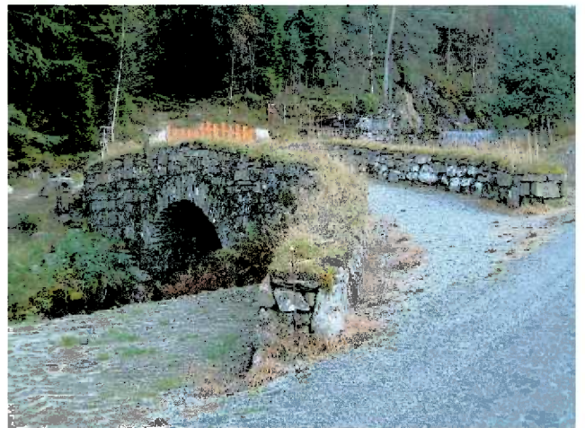
Postvegen Skånevik

Det er ei målsetting at Postvegen gjennom Etne og Kvinnherad skal være ein samanhengande kulturhistorisk turveg.