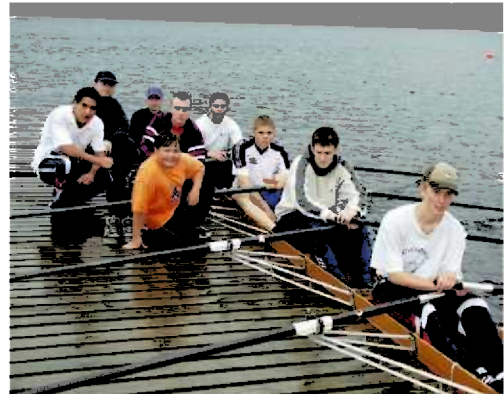
Kvinnherad Rosenter

Kvinnherad rosenter vart etablert i 1991 og held til i Opsangervatnet, Husnes. Anlegget vert drifta av Kvinnherad roklubb og er etablert i tråd med Roforbundet sine retningslinjer og ønskjer. Anlegget består av 500 meter bane, 2000 meter bane og rohuse. Rohuset inneheld møterom, forsamlingslokale, kjøkken, lager, treningsstudio og garderobar. Det er 2 brygger som gir tilgang til vatnet og følgebåt med motor.