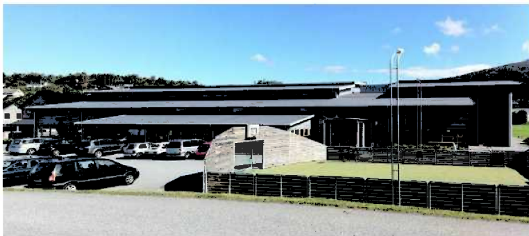
Fitjar kultur og idrettsbygg

Fitjar kultur og idrettsbygg har avtale med Norsk bygdekino. Kinoen har godt besøk og er 6. mest besøkte bygdekinoen i landet.